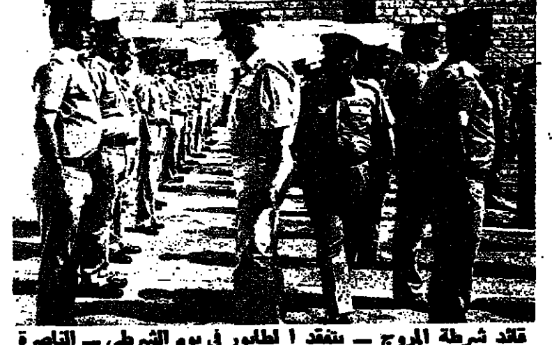
قائد شرطة المروج - يفتقد ا لطابور في يوم الشرطي - الناصرة

من السامة السامة مسارا حتى سماعت الصباح البكر برفقة موكباً يردد وتقوم بولوات في القرى وضارب البسود في الناصرة والناصرة العليا ، ونجيب هذه الاموال ، او تحب الخين الى المسجون